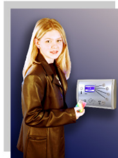
Einfache Bedienung durch Transpondersystem